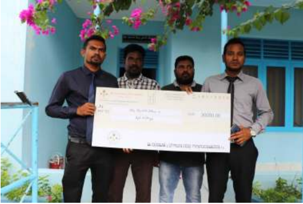
ව. සරසවියේ පරිසර හා වනජීවී සම්පත් සංරක්ෂණය සඳහා වන දායකත්වය ලබාදීමේ චරිත චිත්‍රපටයක් පිළිබඳව විකුණුම් පත්‍රයක් පිළිබඳව විකුණුම් පත්‍රයක් පිළිබඳව විකුණුම් පත්‍රයක්.

11- ව. සරසවියේ පරිසර හා වනජීවී සම්පත් සංරක්ෂණය සඳහා වන දායකත්වය ලබාදීමේ චරිත චිත්‍රපටයක් පිළිබඳව විකුණුම් පත්‍රයක් පිළිබඳව විකුණුම් පත්‍රයක් පිළිබඳව විකුණුම් පත්‍රයක්.