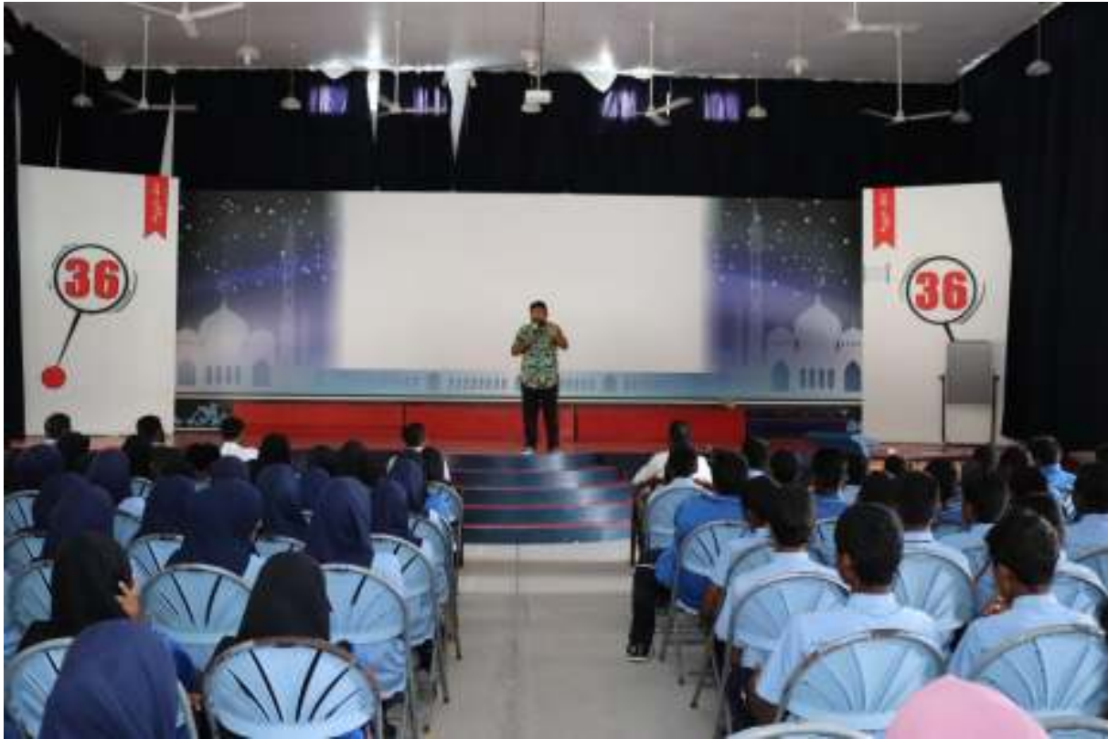
මහා මහලයේ පවත්වා ගන්නා ආගමික සම්මන්ත්‍රණ වාර්තාවේ අංක 18 හි දැක්වෙන්නේ එහි පිටුපසට ඇති පිටුවේ දැක්වෙන්නේ...