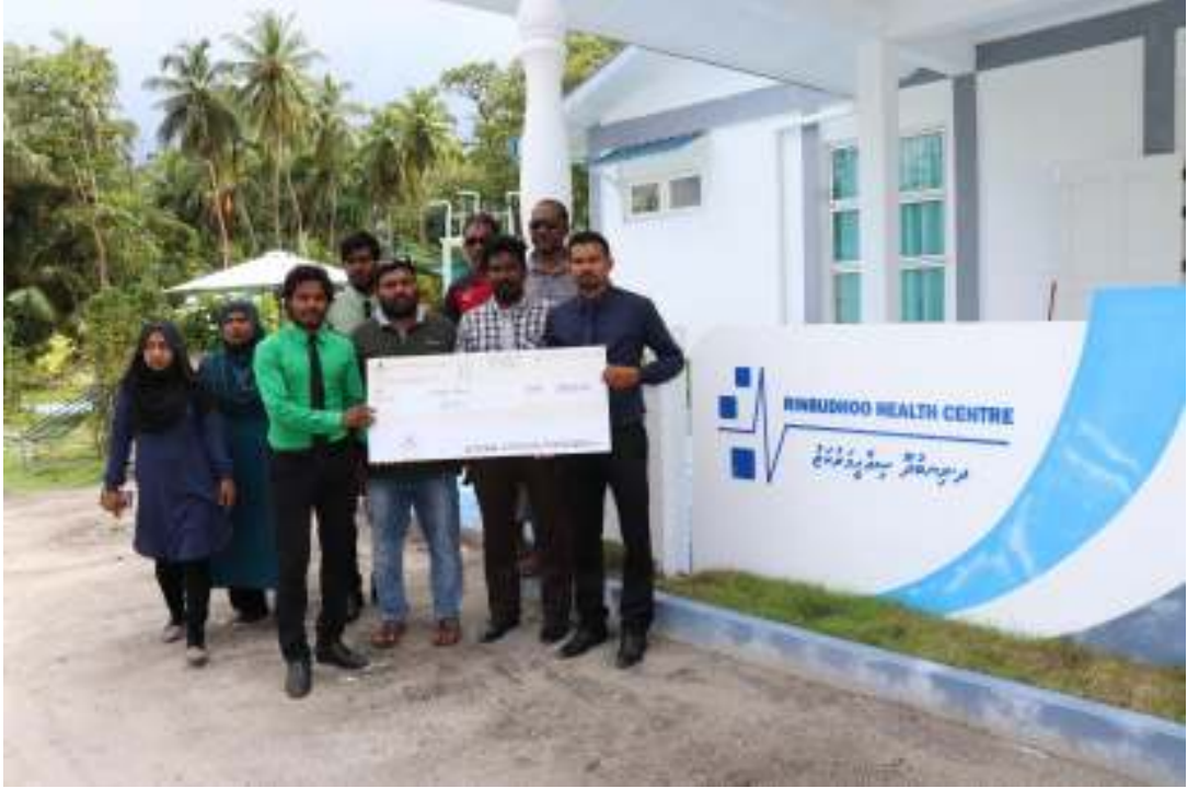
پاکستان رینبوڈھو ہیلتھ سینٹر کے افتتاحی تقریب میں شرکت کرنے والے افراد کی تصویر

6- پانچ ماہ سے زائد سے پہلے رینبوڈھو ہیلتھ سینٹر کے افتتاحی تقریب میں شرکت کرنے والے افراد کی تصویر ، کیونکہ یہ تقریبیں رینبوڈھو ہیلتھ سینٹر کے افتتاحی تقریب کے دوران ہوتی ہیں۔