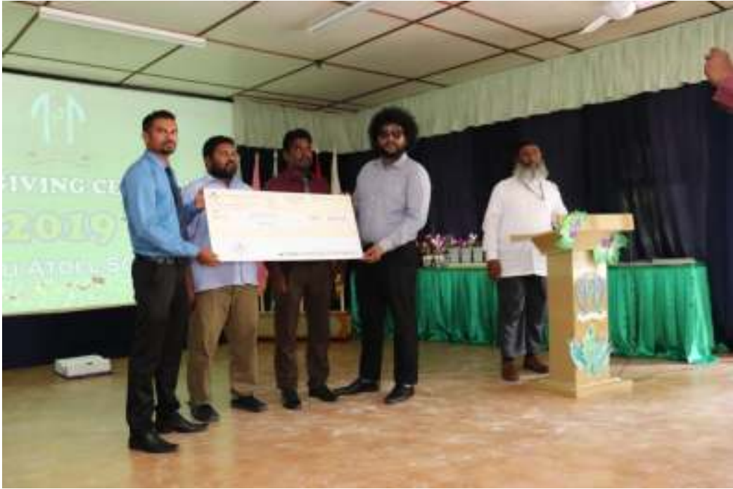
مەنەن ئىلىم ئىنقىلابى رەئىسلىكى تەرىپىدىن ئۆتكۈزۈلگەن

4- مەنەن ئىلىم ئىنقىلابى رەئىسلىكى تەرىپىدىن ئۆتكۈزۈلگەن ئىلىم ئىنقىلابى رەئىسلىكى تەرىپىدىن ئۆتكۈزۈلگەن ئىلىم ئىنقىلابى رەئىسلىكى تەرىپىدىن ئۆتكۈزۈلگەن.