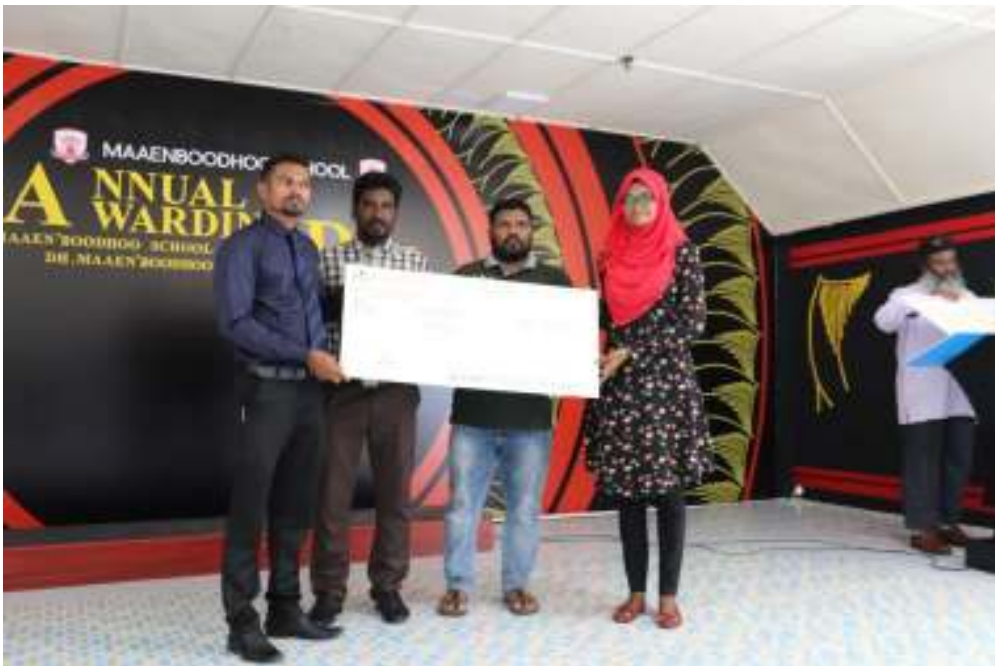
مەنەن ئىلىم ئىنقىلابى رەئىسلىكى تەرىپىدىن ئۆتكۈزۈلگەن

4- مەنەن ئىلىم ئىنقىلابى رەئىسلىكى تەرىپىدىن ئۆتكۈزۈلگەن ئىلىم ئىنقىلابى رەئىسلىكى تەرىپىدىن ئۆتكۈزۈلگەن ئىلىم ئىنقىلابى رەئىسلىكى تەرىپىدىن ئۆتكۈزۈلگەن.