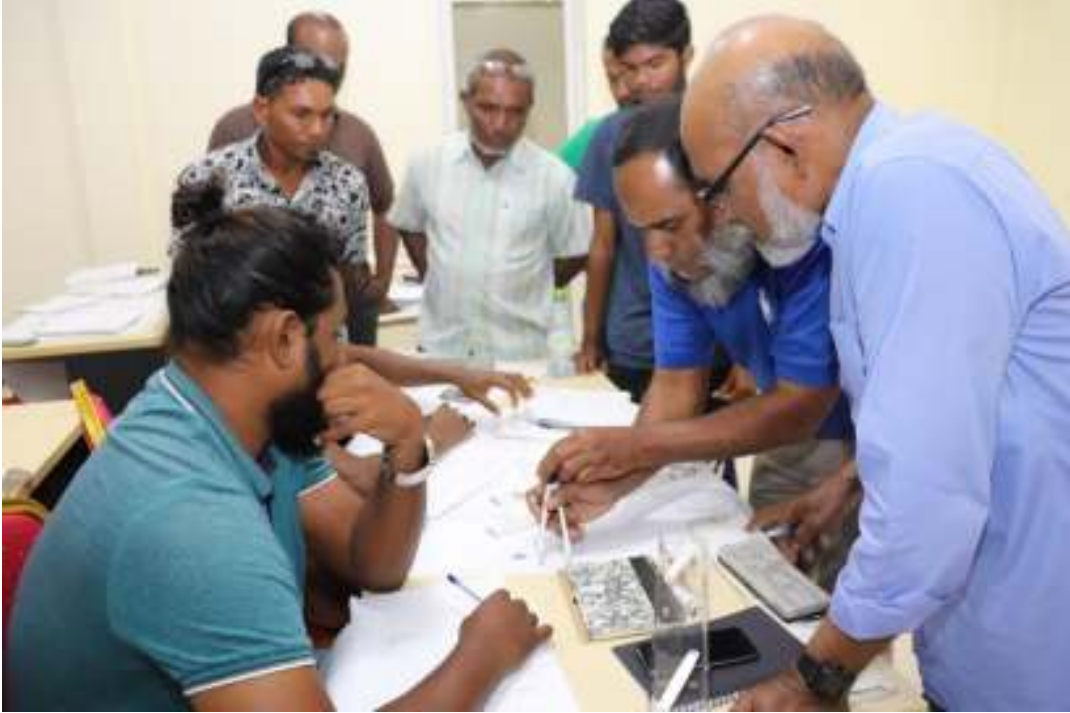
ریفرنڈم سسٹم کی تیاریاں