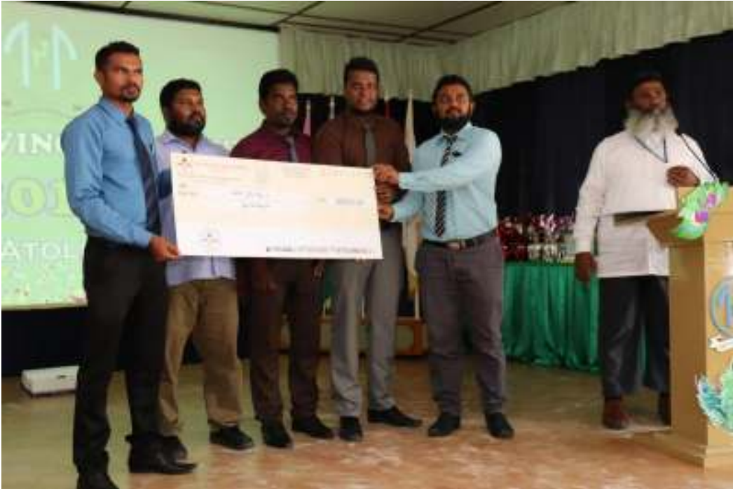
ව. ජනරජ විද්‍යාලයේ පරිසර හා වනජීවී සම්පත් සංරක්ෂණය සඳහා වන දායකත්වය ලබාදීමේ චරිත චිත්‍රපටයක් පිළිබඳව විකුණුම් පත්‍රයක් පිළිබඳව විකුණුම් පත්‍රයක් පිළිබඳව විකුණුම් පත්‍රයක්.

12- ව. ජනරජ විද්‍යාලයේ පරිසර හා වනජීවී සම්පත් සංරක්ෂණය සඳහා වන දායකත්වය ලබාදීමේ චරිත චිත්‍රපටයක් පිළිබඳව විකුණුම් පත්‍රයක් පිළිබඳව විකුණුම් පත්‍රයක් පිළිබඳව විකුණුම් පත්‍රයක්.