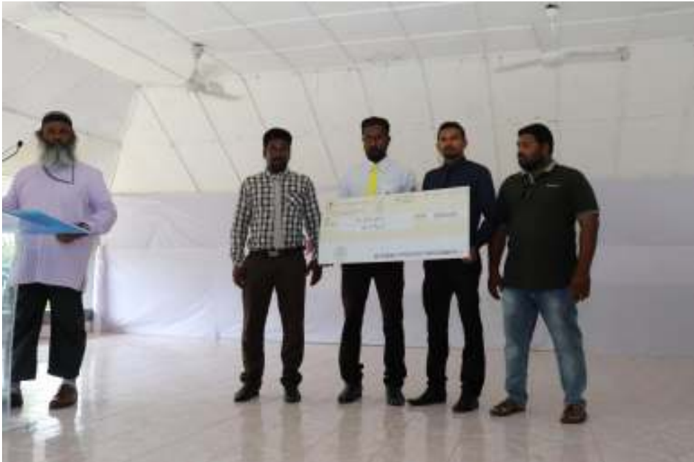
پانچ ماہ سے زائد سے پہلے رینبوڈھو ہیلتھ سینٹر کے افتتاحی تقریب میں شرکت کرنے والے افراد کی تصویر

6- پانچ ماہ سے زائد سے پہلے رینبوڈھو ہیلتھ سینٹر کے افتتاحی تقریب میں شرکت کرنے والے افراد کی تصویر ، کیونکہ یہ تقریبیں رینبوڈھو ہیلتھ سینٹر کے افتتاحی تقریب کے دوران ہوتی ہیں۔