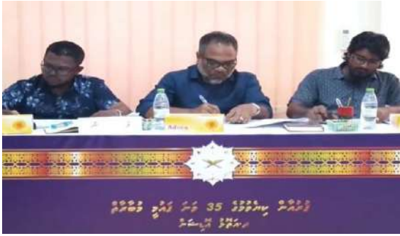
دەلىللىرىمىزنى تەسۋىر قىلىش ۋە تەسۋىر قىلىش ئارقىلىق تەسۋىر قىلىش