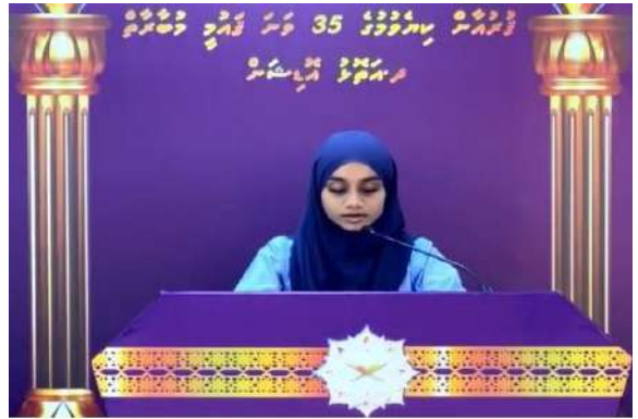
دەلىللىرىمىزنى تەسۋىر قىلىش ۋە تەسۋىر قىلىش ئارقىلىق تەسۋىر قىلىش