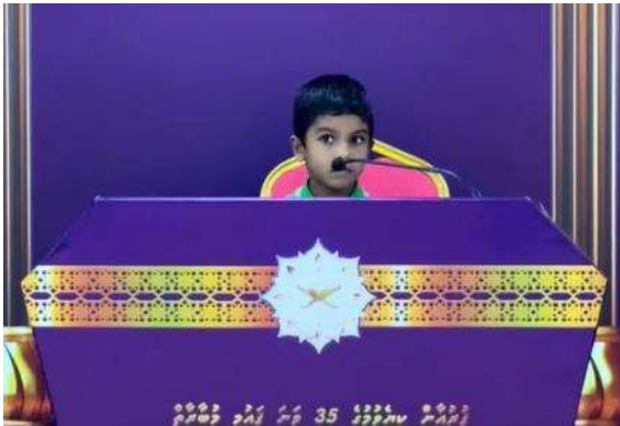
دەلىللىرىمىزنى تەسۋىر قىلىش ۋە تەسۋىر قىلىش ئارقىلىق تەسۋىر قىلىش