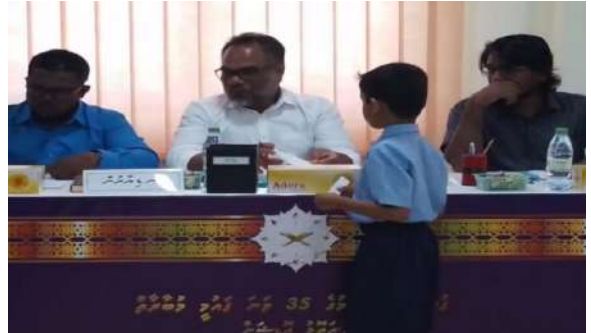
دەلىللىرىمىزنى تەسۋىر قىلىش ۋە تەسۋىر قىلىش ئارقىلىق تەسۋىر قىلىش